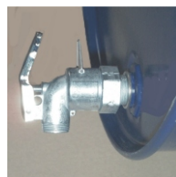
Fatkran aluminium Art.nr. 5999-0200 3/4" -gänga för kem & lösningsmedel. Art.nr. 5999-0101 3/4" -gänga för petroleumprod.