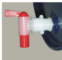
Fatkran Art.nr. V108 St. 3/4" -gänga för kem & lösningsmedel Polyetylen. Art.nr. V108 Ny. För petroleumprod. Nylon.